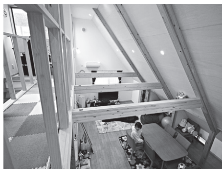
小屋裏からリビングを見る