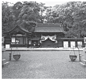
治水神社 (昭和13年御鎮座)

土木スケールの写真は撮りづらい。ケレップ水制を側面から撮ろうと立田大橋の中央部まで歩いたのだが満足のいく写真は撮れず。川下側の歩道に移動して下を見ると直下にケレップ水制が見られた。ドローンが有効か？