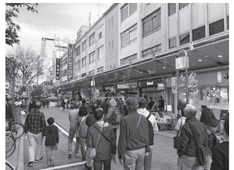
呉服町通りの防火帯建築