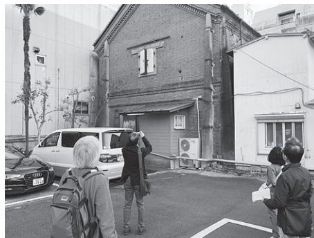
矢沢煉瓦蔵 (道路の反対側より)