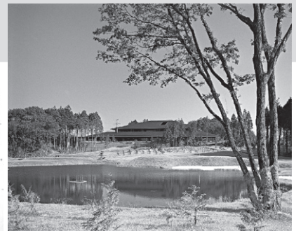
クラブハウス外観

所在地…豊田市芳友町 竣工…1993(平成5)年 構造…鉄骨鉄筋コンクリート造一部鉄骨造 規模…地下1階地上2階建て 延床面積…9,568㎡ 設計監理…伊藤建築設計事務所 施工…清水建設