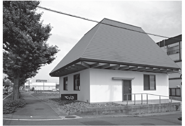
漆喰外壁と屋根が特徴的な外観

店舗併用住宅ということで、北面と西面は住居の生活感が外に出ないように屋根のデザインが生かされ、住宅部分は南面と東面から太陽が燦々と明るく降り注ぐリビングがうまく計画されており勉強になりました。また、スキップフロア形式になっていて、日々の家事動線の工夫(1F店舗→2F脱衣洗濯→物干し)の話も聞くことができ、実際に見学もしてその空間を体験することができました。子ども部屋に関しては、腰壁上の空間が空いているため、プライバシーは保ちつつも何となく軽く仕切った感じを出すことで、一体感があり、リビングとの距離も保つことができる空間になっていました。縦につながった一体感により、どこにいても家族を感じられる「一つ屋根の家」が構成されていました。設計者から聞いたコンセプトと、私たちが体験させていただいた実際空間と、お施主さまの仕事と暮らし