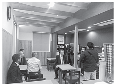
1階店舗空間。お施主さまから感想を聞く様子